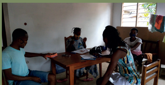
Seguimiento con las familias en Togo