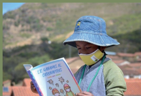
Taller para niños en Bolivia