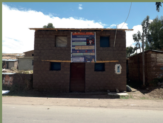
Sensibilización sobre la violencia de género en Perú

En Togo hay un dicho que dice que “educar a una chica es educar a toda la nación”. Es de interés de la humanidad que las niñas y los niños reciban la misma educación.