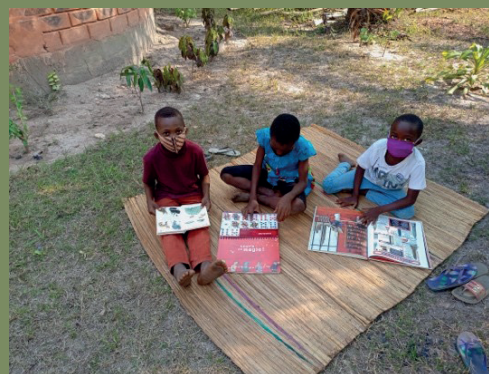
Club de lectura en Togo

Un nuevo estudio de la UNESCO revela que más de 100 millones de niños caerán por debajo del nivel mínimo de competencia lectora debido al impacto de los cierres de escuelas.