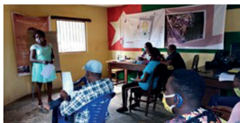
Formación de un equipo de vigilancia de la pandemia en Togo