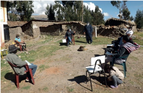
Taller de sensibilización sobre la violencia de género en Perú

Las estadísticas de la Encuesta demográfica y de salud de Togo muestran que la mitad de las mujeres encuentran un trabajo bien remunerado. Independientemente de la categoría laboral, más mujeres que hombres carecen de educación y habilidades.