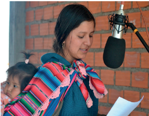
Programa de radio sobre violencia de género en Bolivia