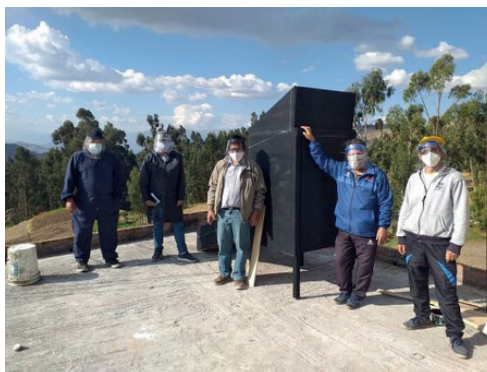
Secadero solar en Perú