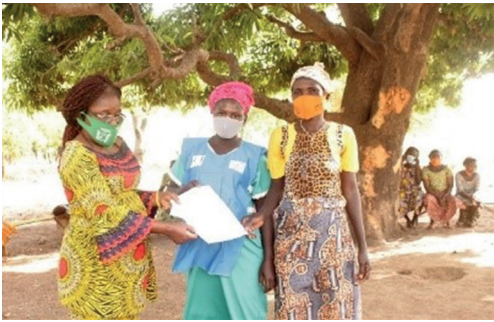
Apoyo a grupos de mujeres en Togo