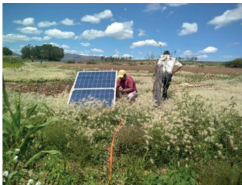
Paneles solares en Bolivia