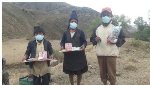
Sensibilización sobre Covid en Bolivia