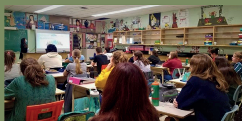
Educación y sensibilización en las escuelas de Quebec