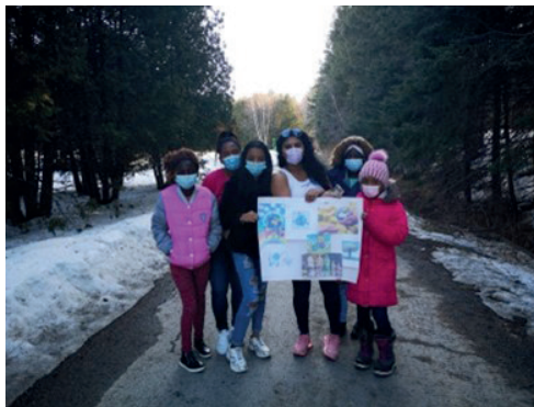
Actividad descubierta en Quebec

Solución 2.13: Utilizar transporte público y medios de transporte de bajas emisiones.