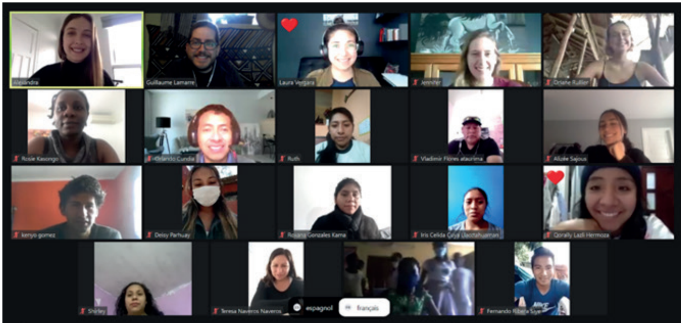
A pesar de las fronteras, las barreras del idioma o el acceso a una buena conexión, los jóvenes se han mostrado interesados en implicarse en este proyecto de solidaridad internacional estando presentes en cada uno de los encuentros del proyecto.