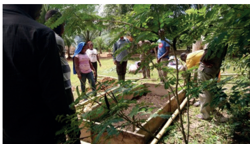
Compostera en Togo