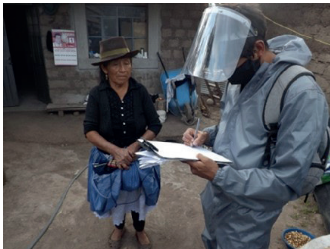
Prevención de la Covid en Perú

Solución 4: Ofrecer servicios públicos de salud mental para todos.